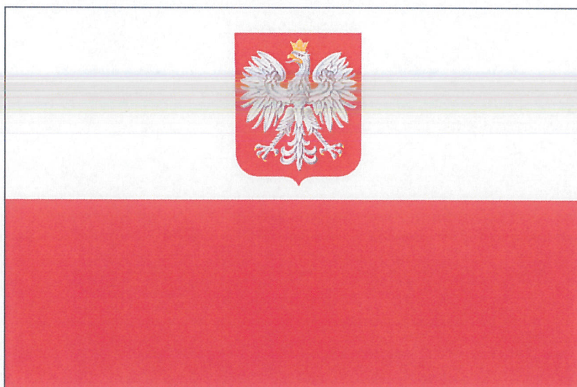
FLAGA PAŃSTWOWA RZECZYPOSPOLITEJ POLSKIEJ

Stosunek wysokości godła do szerokości flagi – wynosi 2:5